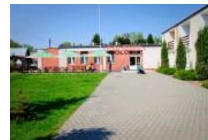
Ośrodek Wypoczynkowy POLONEZ

XVII Konferencję Naukową „DIAGNOSTYKA MASZYN ROBOCZYCH I POJAZDÓW”